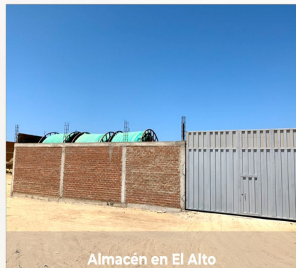
Almacén en El Alto

FCP OILTECH SAC forma parte del grupo SIEBC de empresas que trabajan en la industria energética desde hace más de 20 años y que producen, diseñan y desarrollan sistemas con las más avanzadas tecnologías para la conducción y almacenamiento de todo tipo de fluidos a altas presiones y temperaturas. El grupo trabaja en todo el mundo proporcionando servicios, instalaciones, productos y realizando proyectos llave en mano.