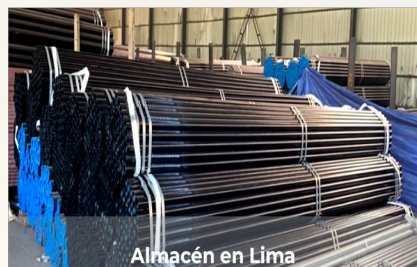
Almacén en Lima