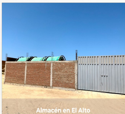
Almacén en El Alto

FCP OILTECH SAC forma parte del grupo SIEBC de empresas que trabajan en la industria energética desde hace más de 20 años y que producen, diseñan y desarrollan sistemas con las más avanzadas tecnologías para la conducción y almacenamiento de todo tipo de fluidos a altas presiones y temperaturas. El grupo trabaja en todo el mundo proporcionando servicios, instalaciones, productos y realizando proyectos llave en mano.