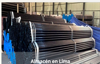
Almacén en Lima